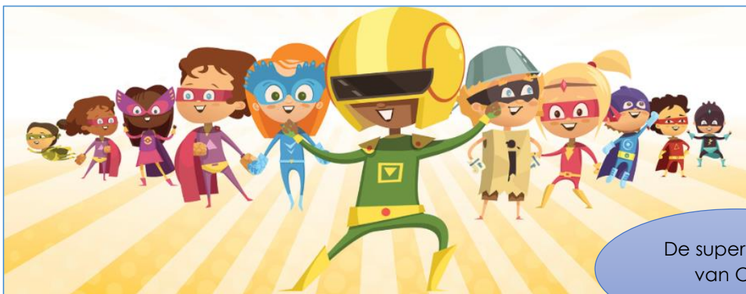
De superhelden van Orka